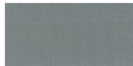
AB428 COL. ANTRACITE