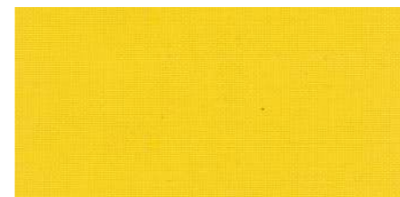
AB437 COL. GIALLO