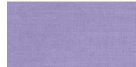
AB422 COL. LILLA