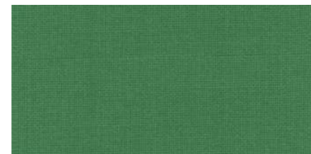
AB430 COL. VERDE PRATO