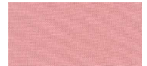
AB436 COL. ROSA