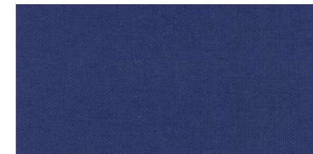
AB446 COL. BLU NOTTE