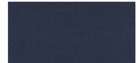
AB412 COL. BLU SCURO