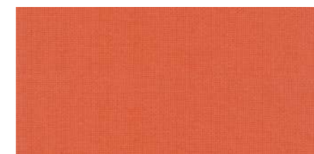
AB438 COL. ARANCIO