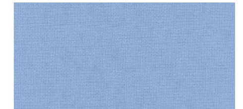
AB423 COL. CIELO