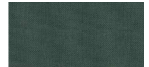
AB433 COL. VERDE BOTTIGLIA