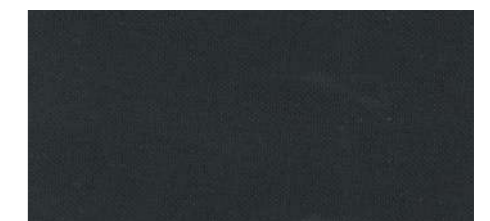
AB449 COL. NERO