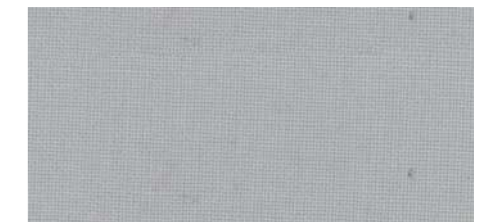
AB427 COL. GRIGIO PERLA