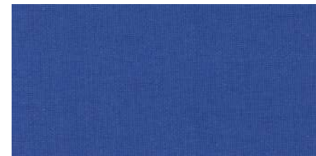
AB445 COL. BLU SCUOLA