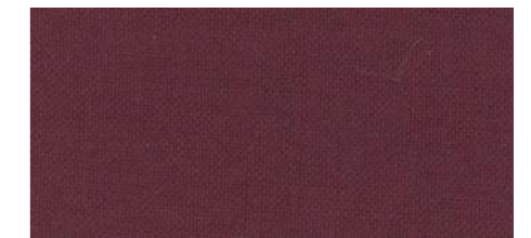
AB434 COL. BORDEAUX