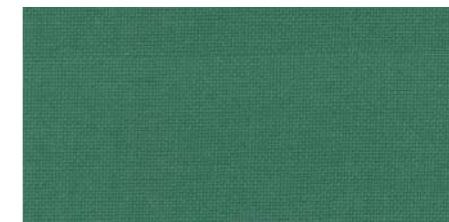
AB432 COL. VERDE BILIARDO