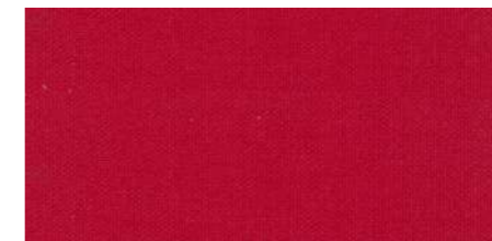
AB439 COL. ROSSO