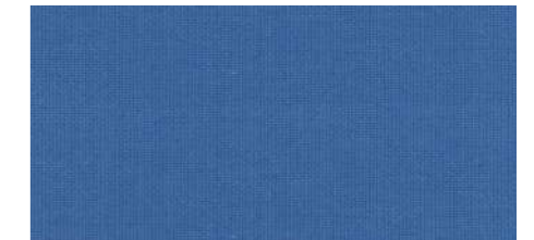
AB443 COL. AZZURRO SCURO