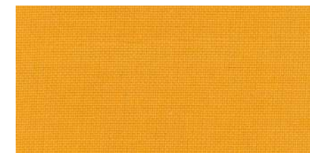
AB435 COL. GIALLO ORO