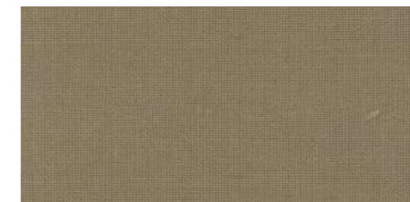
AB447 COL. SAFARI/KAKI