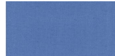
AB442 COL. AVION