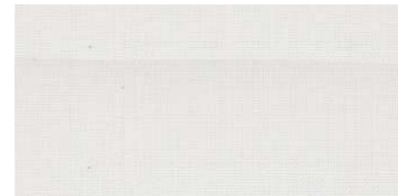
AB411 COL. BIANCO