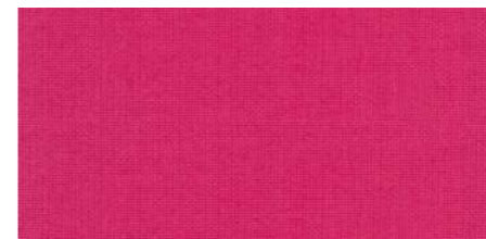
AB440 COL. CORALLO